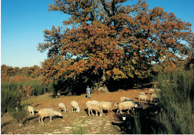
O maior castanheiro da Europa