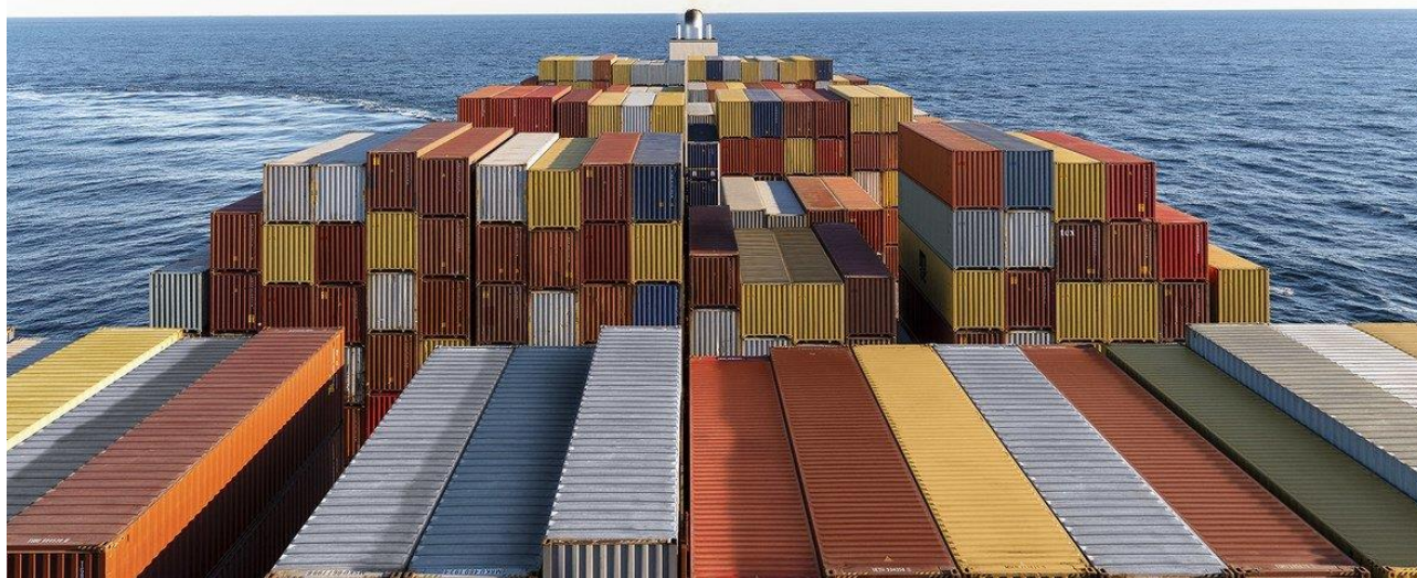
Figura 1: Contentores a ser transportados no oceano. Nações sem saída para o mar também têm dificuldade para receber financiamento em transporte sustentável. | ONU Disponível Aqui

Este transporte pode ser feito por meio de muitas opções de navios, como cargueiros, porta-contentores, navios-tanque, graneleiros (transporte de grãos de cereais), etc.