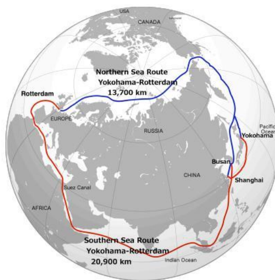
Figura 3: China e Rússia formam parceria para Rota da Seda de Gelo. Mais informações aqui

Com as alterações climáticas e o aquecimento global, o gelo na região do Ártico tem vindo a derreter de tal forma durante o verão que se está a considerar a utilização do oceano Ártico como uma futura rota comercial marítima mais curta entre o Atlântico Norte e a e o Pacífico, ligando assim a Ásia oriental e costa oeste da América à Europa.